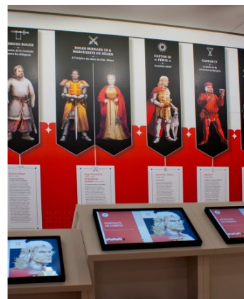
Château de Foix