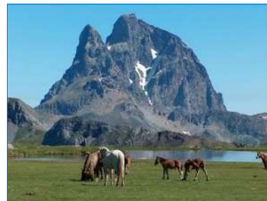
Pic du Midi

Et que dire des bourgades et autres villages, hameaux qui fleurent bon le terroir montagnard, des stations thermales aux charmes surannés, connues et reconnues (Bagnères-de-Luchon, Luz-Saint-Sauveur, Argelès-Gazost) ?