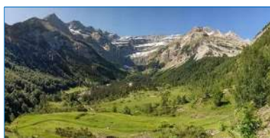
Cirque de Gavarnie

Vous aurez la possibilité de monter sur le toit des Pyrénées, au Pic du midi de Bigorre et ses 2872m pour embrasser toute la chaîne des Pyrénées et découvrir son observatoire à nul ou autre pareil (en option, à réserver par vous-même).