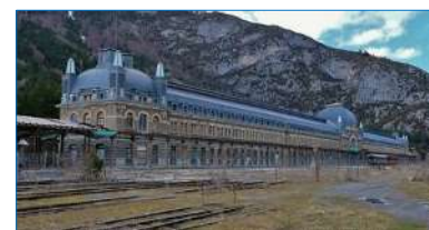
Gare de Canfranc

Tout simplement impressionnante, et encore davantage désormais depuis l'installation d'un palace 5* qui a ouvert