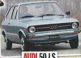
AUDI 50 LS