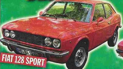
FIAT 128 SPORT