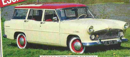
SIMCA VELETTE MARLY