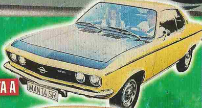
OPEL MANTA A