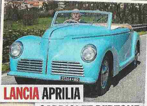
LANCIA APRILIA CABRIOLET BERTONE