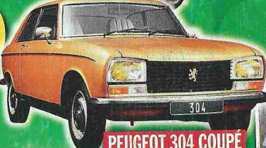
PEUGEOT 304 COUPÉ