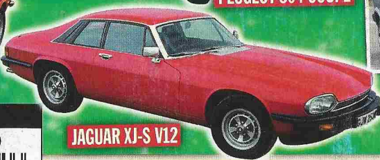
JAGUAR XJ-S V12